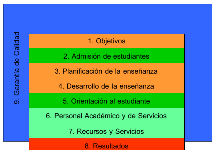
Figura 1. Esquema del modelo de acreditación

La ULPGC, para organizar la gestión de la calidad en los centros universitarios, y con el objetivo de desarrollar las normativas y requerimientos de la ANECA, elabora un reglamento por el cual cada Centro debe confeccionar un Sistema de Garantía de Calidad del Centro a partir de un modelo marco que elaboró el Vicerrectorado con competencias en Calidad. El Sistema de Garantía de Calidad del Centro responde, entre otros, a los requisitos de la ANECA para la acreditación de las enseñanzas oficiales, éstos se articulan sobre la base de 9 criterios de calidad y 46 directrices. La estructura de relaciones que sustenta el modelo se ha construido sobre cinco ejes, cada uno de los cuales hace referencia a uno o varios criterios de calidad, tal y como se presenta en la Figura 1.